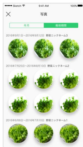
栽培過程を画像で表示